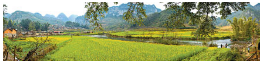
■文山州的資源十分豐富，需要合理的整合才能使這種資源優勢最大化。圖為世外桃源「壩美」。