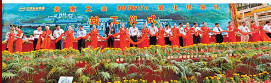
■文山鋁業項目的竣工填補了雲南沒有氧化鋁工業的空白，完善了雲南省鋁工業產業鏈。