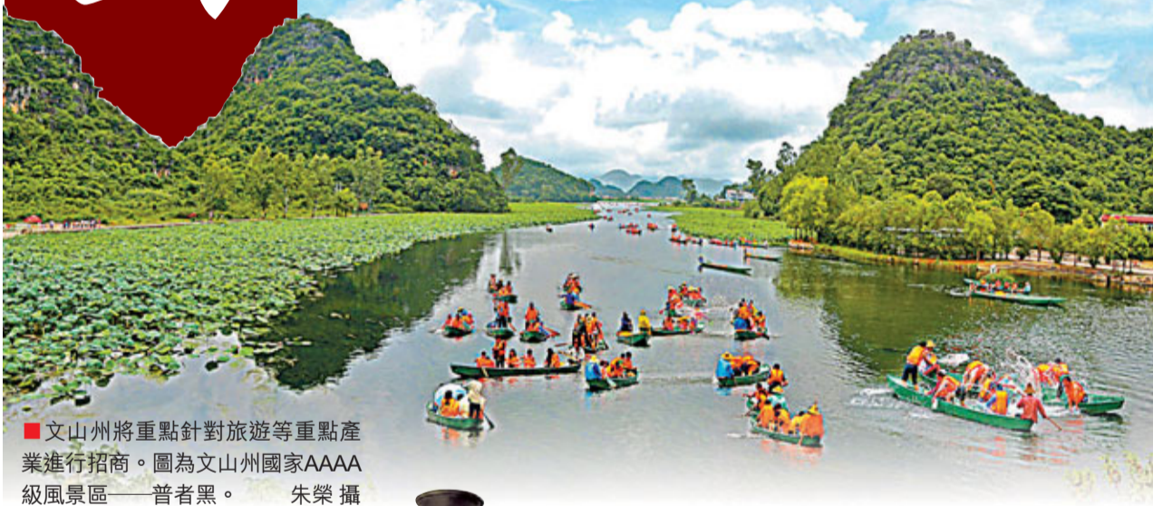
■文山州將重點針對旅遊等重點產業進行招商。圖為文山州國家AAAA級風景區——普者黑。

在「招商引資年」內，文山州將針對生物產業、東部轉移產業（如先進製造業、節能環保業、食品飲品製造業）、商貿物流現代服務業、旅遊產業等重點產業進行招商，並計劃開展產業招商、園區招商、經常性招商、外出招商、會展招商、「請進來」活動、開展區域園區合作等系列活動。