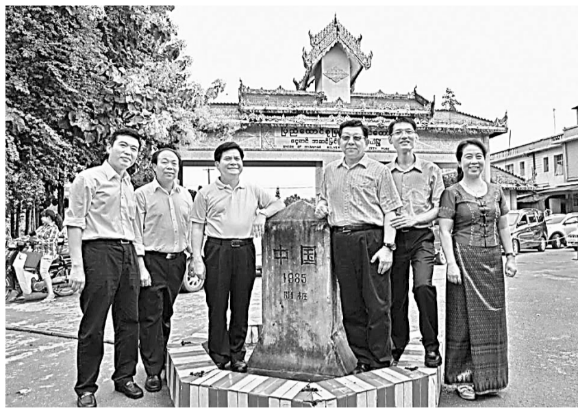
■雲南省長李紀恆(左三)等領導視察瑞麗開發開放試驗區建設情況。