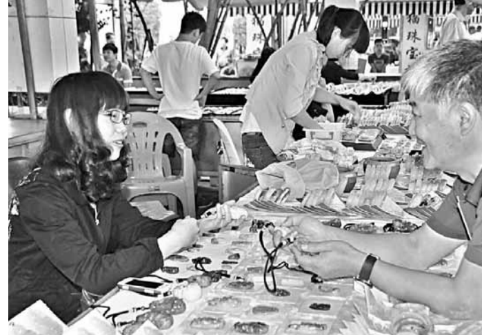
■香港文匯報記者在瑞麗姐告玉城現場採訪。

十月一日至三日，第十二屆中緬波波狂歡節暨第五屆國際珠寶文化節在瑞麗舉辦，與此前舉行的潑水節暨首屆紅木文化節一道，成為德宏打造文化軟實力的重要節慶。中緬波波狂歡節是為增進兩國傳統友誼、弘揚兩國多姿多彩又各具特色的民族民間文化而舉辦的國際節慶活動。本次「雙節」活動在瑞麗重點開發開放試驗區實施方案獲國務院批准的背景下舉辦，與往届相比有多個亮點，牛車選美報名參賽隊創下最高紀錄，中緬風情巡遊表演人數增加到千人以上，「天工」獎玉雕大賽也首次在瑞麗開設了預選賽區。「兩節」同慶、全城共歡、萬民齊樂。瑞麗整合節慶資源，發展節慶產業，放大節慶效應，借節慶提升「東方珠寶城」、「西部紅木之都」、「有一個美麗的地方」的文化含量、文化附加價值和文化力，鑄造文化軟實力，產生了顯著的經濟、文化、旅遊等領域的交流與合作空間。