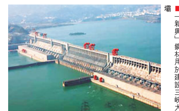
■「新興」鋼材用於建設三峽大壩

奮戰100天，吃住在現場，堅守在一線；奮戰100天，打破作息常規，與時間賽跑；奮戰100天，放棄一切節假休息日；奮戰100天，取消一切不必要的應酬。這100天內，既要拾遺補缺，還要爭創優質項目、精品工程，時間之緊、任務之重、困難之大、可想而知。但來自集團和祖國各地的建設者們，用超常規的