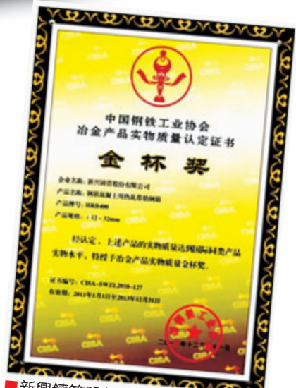
■新興鑄管股份有限公司出產的鋼筋 混凝土用熱軋帶肋鋼筋獲得中國鋼鐵 工業協會冶金產品質量金杯獎

「幾度探索，幾番拚搏，天山的雄姿把希望寄托；援疆的路，寬闊的路，凝聚的力量在陽光下匯合；新興際華，從不退縮，坎坷的道路從容走過；新興際華，堅定執着，光明的道路高奏凱歌……」一首「援疆之歌」，讓人領略到了新興際華集團援疆的凌雲壯志，體會到了新興際華集團援疆的深切情懷，也看到了新興際華集團援疆的堅實足跡。