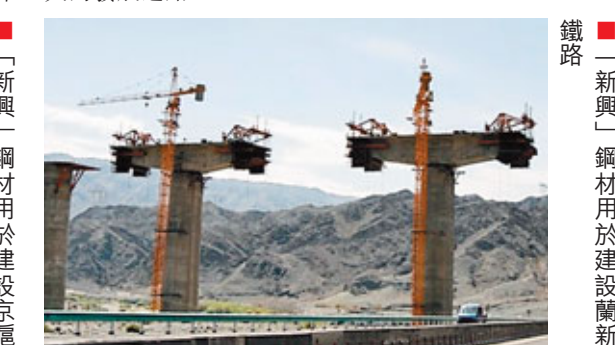
■「新興」鋼材用於建設京滬