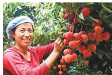
■博羅縣龍華鎮山前荔枝喜獲豐收

記者注意到，惠州十分重視農業標準化和農產品安全體系建設，累計制定地方農業標準40項，建成市級以上農業標準化示範區29個，有「三品」（無公害農產品、綠色食品、有機農產品）認證企業135家、基地140個、產品303個；有省市級名優農產品87個，其中省名牌產品21個、市名優產品66個。市縣（區）兩級均建有農產品質檢中心，全市有農業的鎮辦100%建有農產品質檢站，每年抽檢農產品樣品30多萬個，總體合格率98%以上。