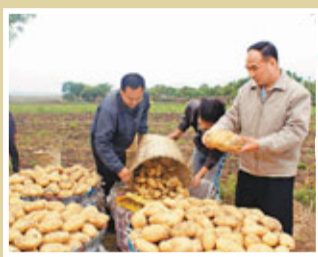
■惠陽區平潭鎮冬種馬鈴薯喜獲豐收