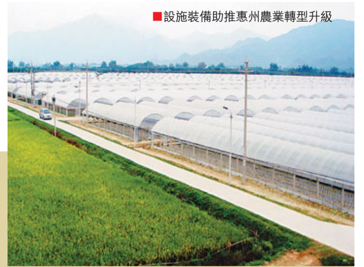
■設施裝備助推惠州農業轉型升級