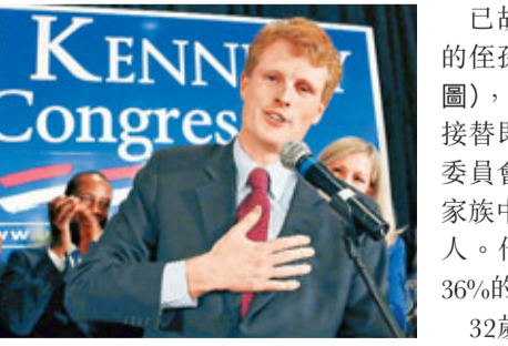
已故美國前總統約翰·肯尼迪的任孫約瑟夫·肯尼迪三世(見圖)，昨日當選麻省聯邦眾議員...