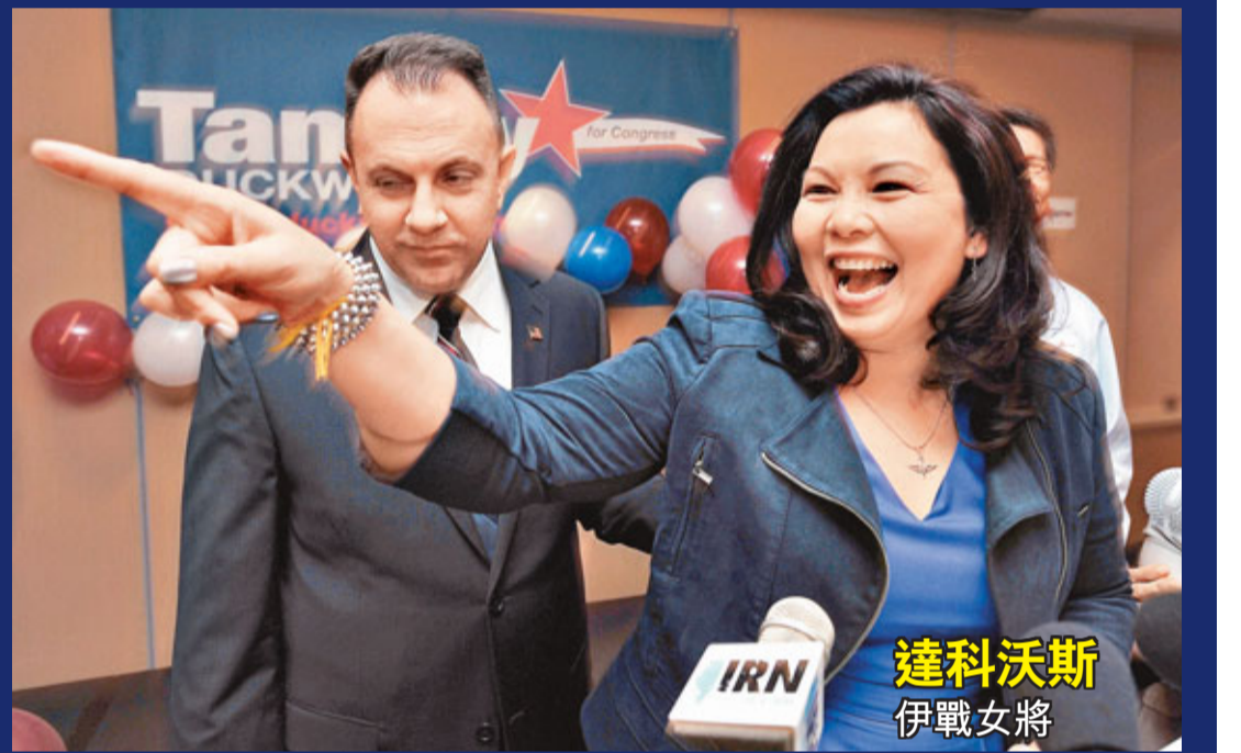
達科沃斯伊戰女將