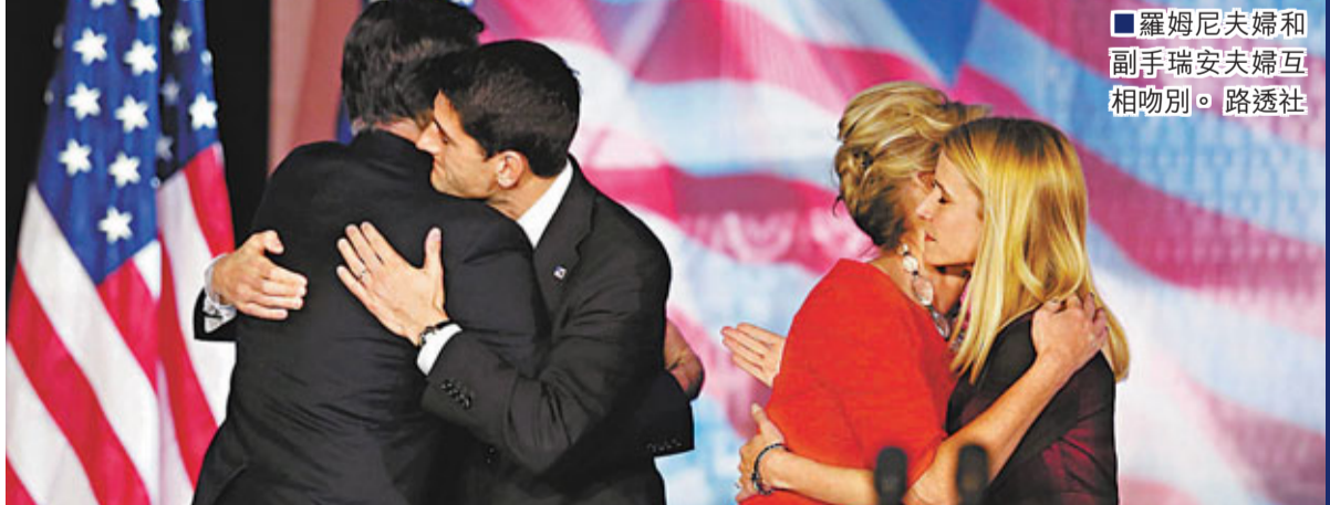
■羅姆尼夫婦和副手瑞安夫婦互相吻別。

「我要對羅姆尼州長說幾句話，我對他和（其拍檔）瑞安在這次激烈選舉中的表現表示祝賀。我們可能爭奪得很激烈，但這僅僅因為我們深愛這個國家，以及我們熱切關心她的未來。我期待今後幾周能與羅姆尼州長坐下來，討論從何着手一起努力推動美國前進。 如果不是那位20年前願意嫁給我的女人，我不會成為今天的我。請讓我公開說出下面這段話：米歇爾，我對你的愛無以復加，我無比驕傲地看到其他美國人也愛上你——我們的第一夫人。（女兒）薩莎和馬莉婭，在所有的人見證下，你們正成長為兩位堅強、聰明和美麗的少女，就如你們的母親。我以你們為榮，不過我想說，家裡養一隻狗已足夠了。 儘管存在各種分歧，大多數人都對美國的未來有共同的期望，希望我們孩子成長的國家能讓他們上最好的學校、接受最好的教導。我們對如何實現這一目標有分歧，有時分歧還很嚴重，正如兩個多世紀以來一樣，進展將是斷斷續續，並非總是一帆風順。 在未來數周和數個月，我期待與兩黨領袖接觸並合作，面對團結一致才能解決的問題。無論是否贏得你們的選票，我都聽到你們的聲音，並學會更多，你們將使我成長為更好的總統。在今天的選舉之夜，是你們——美國人提醒了我們，雖然道路艱難、征程漫漫，我們選擇了自己、贏得了戰鬥。我們深知，美國最好的時代尚在前方。」