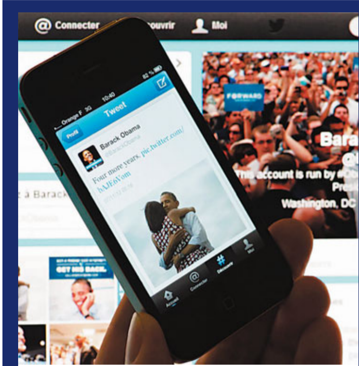
■奧巴馬率先在twitter發布連任好消息。

美國總統奧巴馬得以連任，搖擺州份功不可沒。在被視為勝負關鍵的9個搖擺州中，奧巴馬拿下俄亥俄、弗吉尼亞、艾奧瓦、內華達、威斯康星、新罕布爾和科羅拉多7州，「得俄州得天下」定律再度應驗。羅姆尼僅拿下北卡羅來納一個州份。擁有29張選舉人票的佛羅里達州尚未完成點票，但無論結果如何，羅姆尼也翻盤無望。