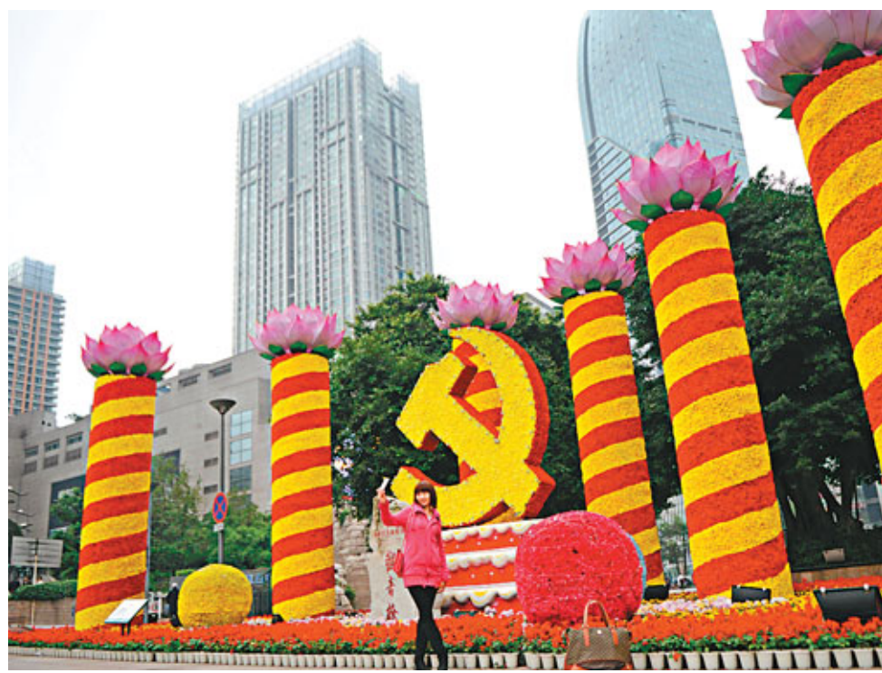
中國共產黨第十八次全國代表大會今天召開，重慶市商業步行街上用鮮花織成的中共黨徽吸引市民合影留念。

■ 十八大報道組 胡海岩、何凡、房慶、林舒婕、劉坤領、黎軼璋、趙一存、王添翼、高麗丹、田一涵