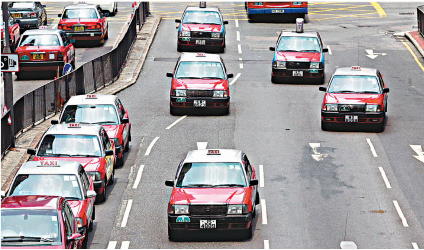
■低息環境持續，被視為經濟寒暑表的的士牌價近月再被炒高，推升至約680萬元的歷史高位。

香港文匯報訊 (記者 陳遠威) 被視為經濟寒暑表的的士牌價近月再被炒高，推升至約680萬元的歷史高位，有分析認為，牌價瘋狂，主要由於美聯儲推出QE3及低息環境持續在推波助瀾，加上現時樓市降溫，預計受資金流入帶動，的士牌價將可繼續攀升。