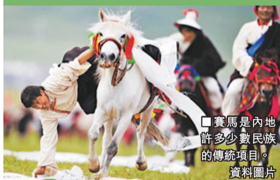
賽馬是內地許多少數民族的傳統項目。資料圖片

事實上，近年內地各種形式的「馬術節」、「馬術大賽」、「馬文化博覽會」等活動已不再是新鮮事物，成為資本商業力量和文化社會因素交織的平台。據統計，截至2011年底，全國的馬術俱樂部已有1,500多家，各大城市的馬迷也數以十萬計。而且，透過2008年北京奧運會和2010年廣州亞運會的電視和網路直播，內地的絕大多數觀眾也首次觀看到精彩紛呈的馬術比賽，領略到馬術比賽的魅力。在大型體育盛會的推動下，中國傳統馬文化的潛移默化、城市休閒方式的精英化、民間投資流動模式的國際化也在客觀上促成現代中國馬術和馬文化的復興。