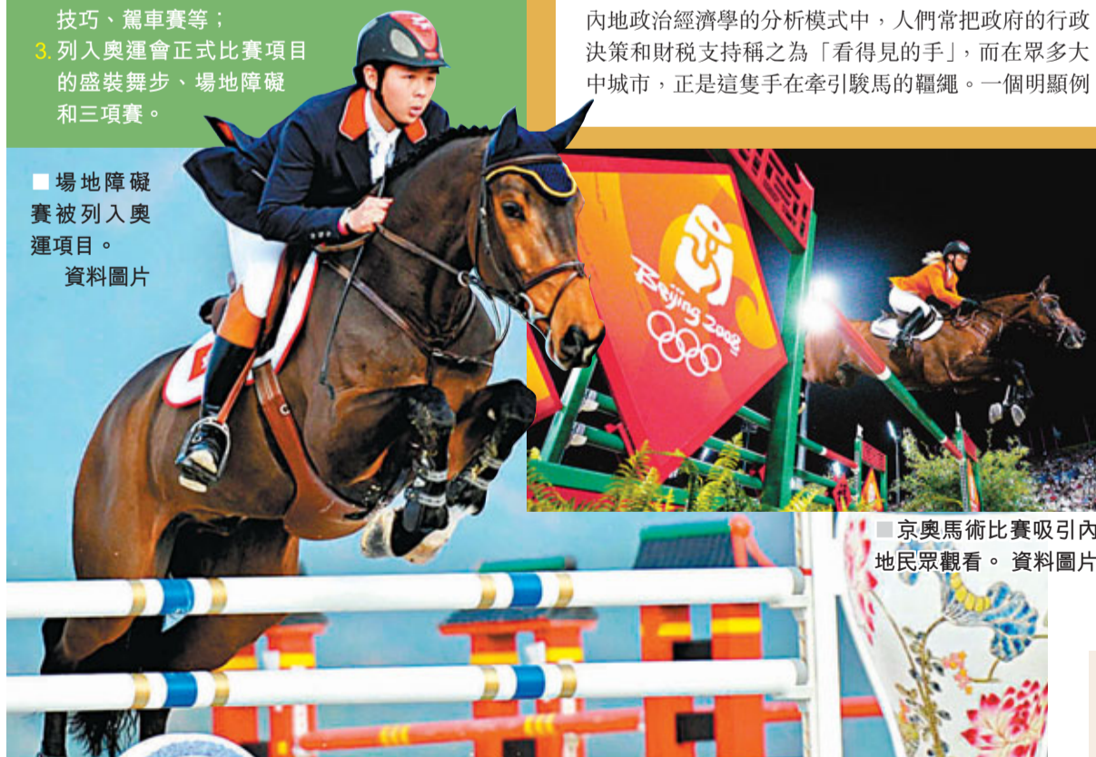
京奧馬術比賽吸引內地民眾觀看。資料圖片