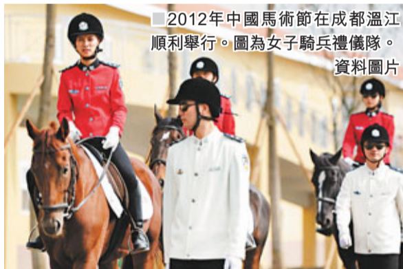
2012年中國馬術節在成都溫江順利舉行。圖為女子騎兵禮儀隊。資料圖片

最後，國家對賽馬的探索仍在繼續。對絕大多數港人來說，「賽馬」已成為日常生活中一部分；而香港的賽馬文化也是舉世聞名，成為香港最引人矚目的都會名片之一。據統計，香港專業分析賽馬的報刊就有30多種，而且每份主流報章都有馬評版，電視頻道也如是。此外，港府稅收有近兩成來自賽馬及其相關產業。雖然中國馬術協會在改革開放初加入國際馬術大家庭，而且也是亞洲賽馬聯盟的重要成員國，但在內地的制度層面上，賽馬卻因「博彩」特質而發展緩慢。