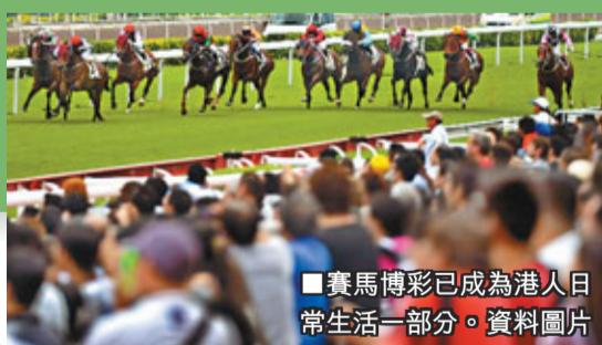
賽馬博彩已成為港人日常生活一部分。資料圖片

最後，「馬彩」和賽馬經營的前景不明朗。在賽馬產業發展成熟的國家和地區，賽馬事業運營的三大業務包括賽事施行、馬票銷售(馬彩)和人員執照註冊，均由獨立委員會運營，而其中最受關注的是「馬彩」。馬彩是一種健康的娛樂方式，可提振經濟、增加國家和地方稅收，也是社會公益的重要扶持力量。但國家相關部門擔憂如果馬彩合法化和普及化，將導致網上博彩氾濫，非法博彩出現，同時引發各種社會問題。越來越多專家學者呼籲，馬彩應履行而不是禁行，這樣才可為賽馬注入活力。