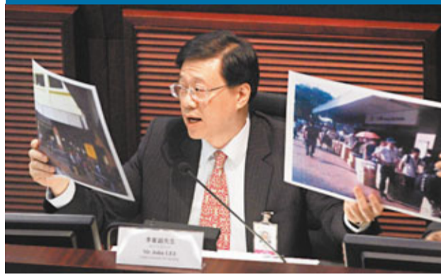
李家超表示，「風沙行動」已初見成效，但掃蕩行動仍會繼續。

香港文匯報訊(記者 林曉晴)水貨客問題嚴重，對北區居民帶來滋擾。入境處聯同警務處早前採取多次名為「風沙」的大規模掃蕩行動，共拘捕了372名涉嫌違反逗留條件的內地居民，當中30人已被定罪及判監2個月。昨日立法會保安事務委員會舉行會議，會上保安局指出，「風沙行