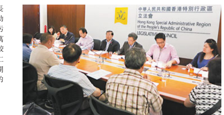
一批市民向立法會議員申請，要求當局遏止賭風。

香港文匯報訊(記者 林曉晴)為應付前政務司司長許仕仁涉貪污案，廉政公署擬於執行處開設一個助理處長的編外職位，以領導高度敏感及複雜的貪污調查工作，為期30個月，所需的年薪開支為169萬元。廉署表示，現時廉署正在調查2,258宗案件，較去年同期增9%，因此已無法騰出人手處理「許仕仁案」。有立法會議員擔心，日後遇有複雜案件便要開設新職位，廉署回應，是否開設職位需視乎案件的性質，不認為會成為「先例」。 屬執行處編外職 年薪169萬 許仕仁涉貪污案，廉政公署擬於執行處開設一個助理處長的編外職位。此外，亦擬開設一個臨時的特別職務組，共有16名成員，以提供支援。建議的助理處長的編外職位，年薪約為169萬元，而16名成員的年薪開支則為1,060萬元。有關職位至2015年6月。 副廉政專員黃世照昨日在立法會保安事務委員會會議上表示，就案件的複雜性，敏感度與重要性而言，實在需要一位具豐富經驗，並屬助理處長職級的高級人員全權指揮。他強調，「許仕仁案」相當複雜，且涉及層面廣泛，工作亦相當艱巨。最後，保安事務委員會原則上支持增設職位，建議稍後將提交財委會編制小組委員會審批。