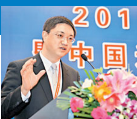
■昂納總裁那慶林認為，南山區為企業提供了良好的創新環境。

南山區與香港在資本與產業、人才與科研等領域互補性強，如今南山區已經成為深港科技合作的首選區，產業規模顯現效應。南山與香港的產業合作，已由以前簡單的資金和項目轉移，逐步向創投、研發等全方位合作方向轉變，而南山發達的高新技術產業環境也對香港的研發成果轉化形成有力支撐。