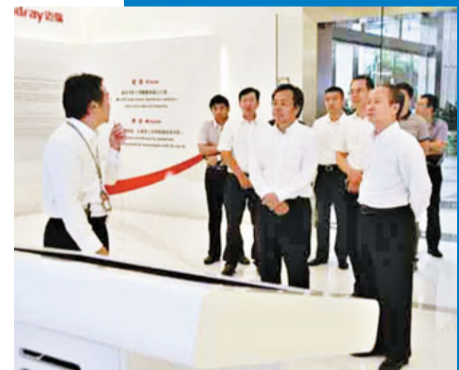
■南山區委書記李小甘調研轄區高新技術企業 (網上圖片)

南山區的服務業增速超過工業，構建現代產業體系成效初現。記者了解到，南山區今年上半年現代產業體系實現增加值超過1000億元，佔本地生產總值的近90%。其中，現代服務業發展迅猛，實現增加值340億，增長11.3%，對南山區經濟增長貢獻率達37%。