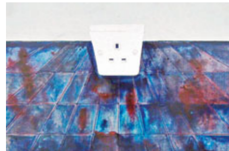
■畫寧，插座(二)(未完成)，29.5 x 42 x 3 cm