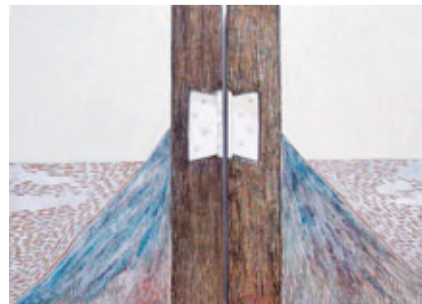
■畫寧，門鉸，42 x 59 x 3 cm