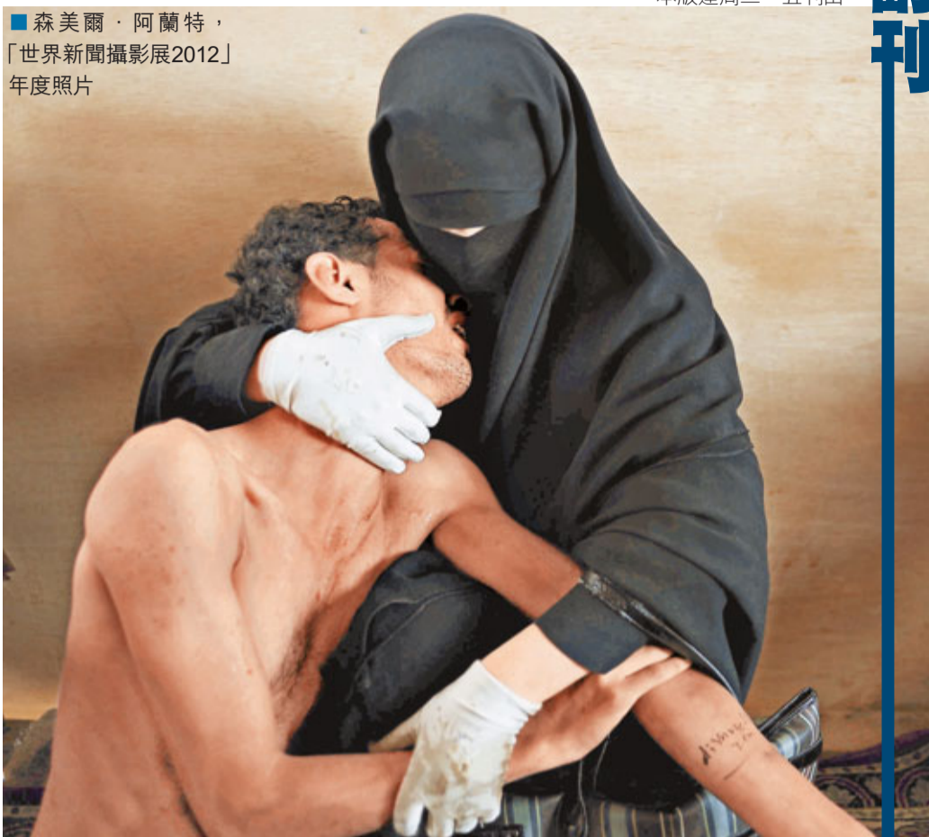
■森美爾·阿蘭特，「世界新聞攝影展2012」年度照片

在剛剛結束的十月，有一場展覽想必每位新聞工作者都不願錯過——在知專設計學院展出了為期半個月的「世界新聞攝影展2012」，再度向人們展示了「影像紀錄」的力量。「世界新聞攝影比賽」作為新聞攝影界首屈一指的國際比賽，時隔九年後，再次登陸香港展出獲獎作品，本年度獲獎的167幅作品，是從來自124個不同國家送交參賽的十萬餘幅作品中所選出，其中包括「年度最佳照片」，以及肖像、新聞人物、普通新聞、日常生活等九個類別中的得獎照片。而在攝影如此普及化的今日，傳統新聞攝影是否仍具有價值，或許便是這場展覽可以引發的一些相關思考。