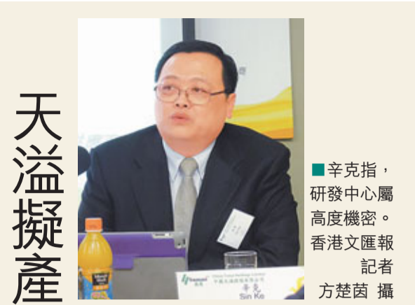
■辛克指,研發中心屬高度機密。

《報告》藍皮書由人民日報香港分社、新華社香港分社、國家信息中心和中國文化院共同策劃。新華社香港分社