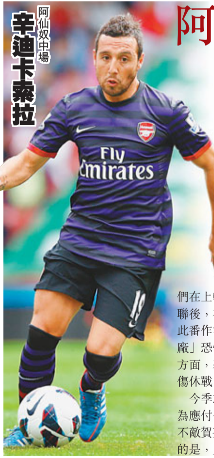
阿仙奴中場 辛迪卡索拉