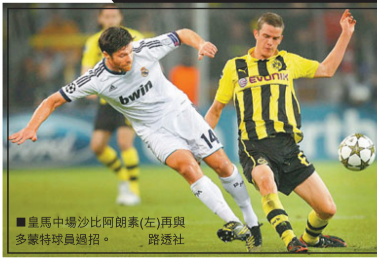
皇馬中場沙比阿朗素(左)再與多蒙特球員過招。