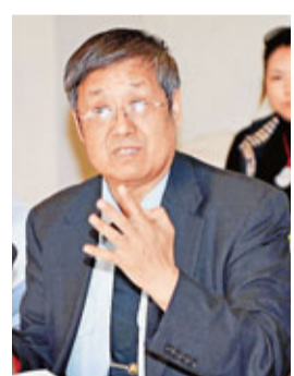
軍國防大學教授胡思遠(小圖)表示，如能對存在爭議的島嶼進行經濟開發，會有助於主權紛爭的解決。

香港文匯報訊（記者 張瀛戈 深圳報導）第六屆海洋文化論壇昨日在深圳舉行，10餘位來自全國各地的文史地理及海洋學界專家和學者共同出席並就當下最為熱門的時政話題「中國的海島問題的歷史與現實」進行激烈討論。對於東海和南海的海權紛爭問題，中國人民解放軍國防大學教授胡思遠(小圖)表示，如能對存在爭議的島嶼進行經濟開發，會有助於主權紛爭的解決。