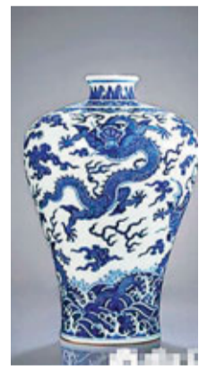
香港文匯報訊 據《武漢晚報》報導，一起不起眼的盜墓案，竟然牽出了一個龐大的盜墓、倒賣文物團伙，查獲了一級文物8件，二級文物36件，數量之多、規格之高連國家文物局的專家組都忍不住驚歎。而從經濟價值上看，價值更是無法估量。4日，湖北省公安廳召開新聞發佈會宣告：公安部督辦的特大盜掘古墓、倒賣文物案告破，追回老祖宗留下的198件珍貴寶貝。

據悉，這批文物裡有一級文物8件；二級文物26組36件；三級文物71組104件；一般文物46組50件。這些文物中，有春秋早期、中期和西漢時期的青銅鼎、青銅錯銀牙鏃等一級文物；還有西周中、晚期和商周、戰國時期的青銅尊、幾何雲氣紋錯金青銅牙鏃等二級文物。其中一件春秋時期的鼎，經文物專家鑒定為國家一級文物，其墓主人為曾侯寶。曾侯寶比曾侯乙還早200到300年。此鼎被追回，填補了這個時期的研究空白。