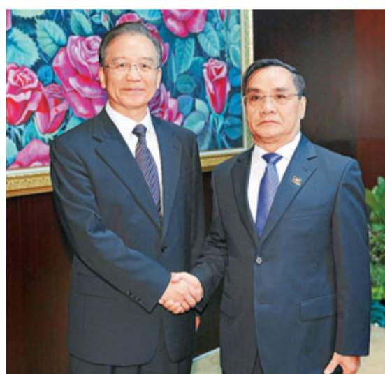
■溫家寶總理5日在萬象與老撾總理通辛舉行會談表示，願同老方攜手應對各種挑戰。

亞歐會議成立於1996年，是亞洲和歐洲之間的政府間區域對話論壇，旨在通過加強對話與合作，建立亞歐新型全面夥伴關係。在今天的擴員儀式上，孟加拉國、挪威、瑞士正式加入，至此亞歐會議實現「擴容」，成員增至51個。本屆亞歐首腦會議的主題是「和平學友，繁榮夥伴」。