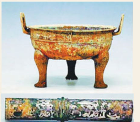
■青銅鼎(上圖)、青銅錯銀牙鏃(下圖)均為一級文物。

據介紹，這尊梅瓶一出場即受到買家熱烈追捧，以3,500萬元起拍後，經過近20分鐘角逐，最終以8,500萬元落槌，加上佣金總成交價達到9,775萬元。