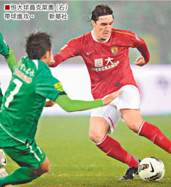
■恒大球員克萊奧(右)帶球進攻。