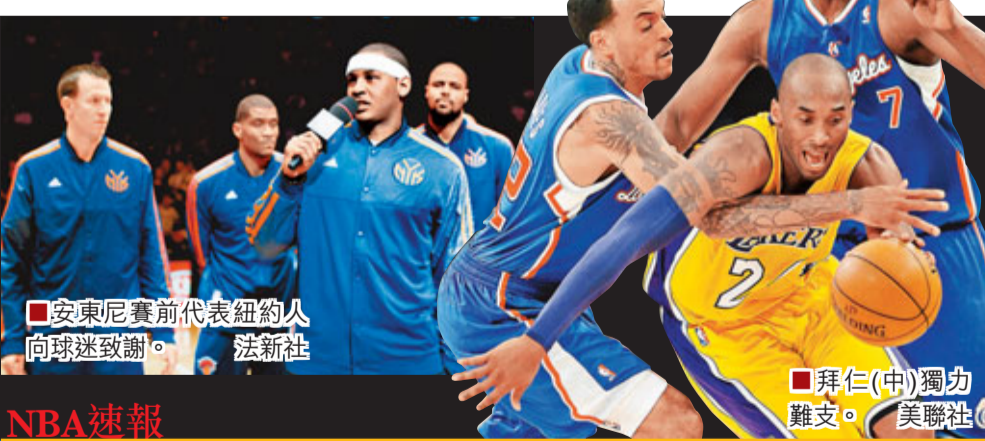
安東尼賽前代表紐約人向球迷致謝。