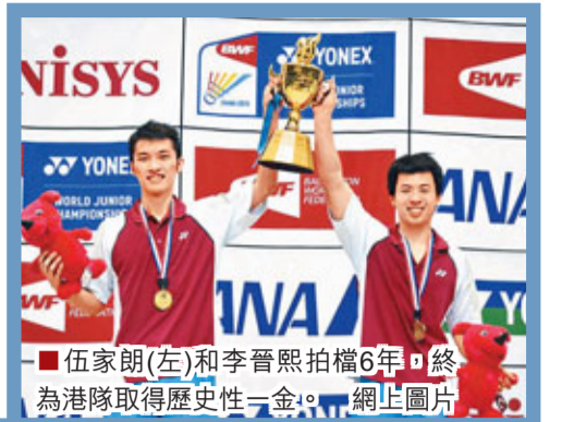
伍家朗(左)和李晉熙拍檔6年，終為港隊取得歷史性一金。

香港羽毛球代表隊寫下創舉！伍家朗/李晉熙這對男雙組合昨日在世青賽決賽中以直落2局擊敗東道主日本，為港隊贏得一面歷史性金牌，這不單是港羽隊在國際大賽的首面金牌，更是伍家朗/李晉熙這對組合拍檔6年的血汗結晶。看着特區區旗在場館上徐徐升起，港隊總教練何一鳴、伍家朗和李晉熙皆難掩激動心情。