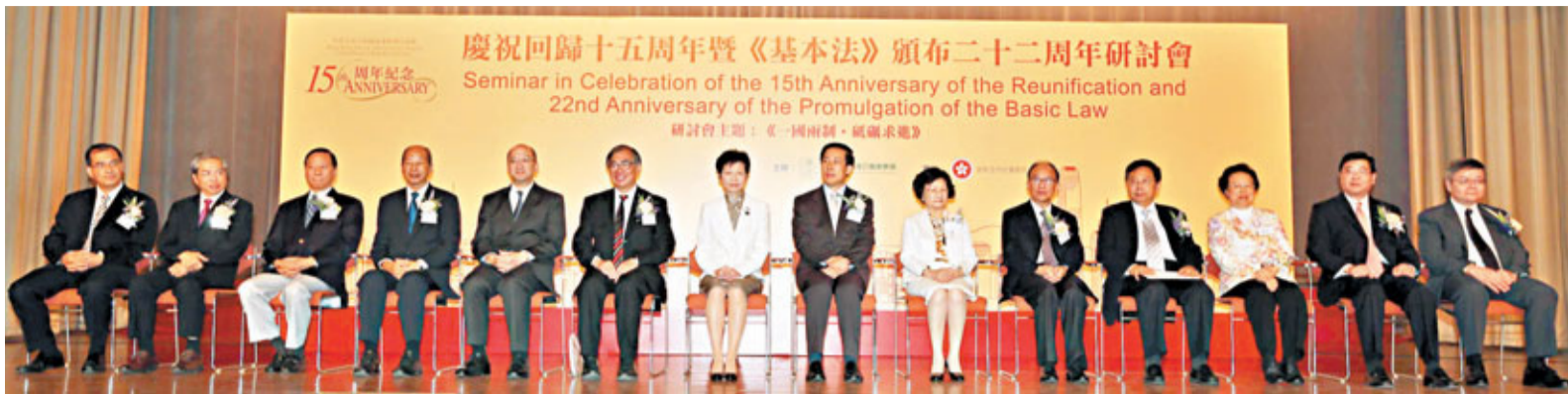
香港基本法推介聯席會議舉辦「一國兩制·砥礪求進」研討會，近300人出席。

香港文匯報訊(記者 鄭治祖)《基本法》頒布至今已逾22個年頭，香港基本法推介聯席會議昨日舉辦「一國兩制·砥礪求進」研討會，邀請官員、商人、學者共同探討如何繼續發揮《基本法》賦予自由、權利，使香港繼續發展。中聯辦副主任楊建平，香港特區政府政務司司長林鄭月娥，政制及內地事務局局長譚志源，香港基本法推介聯席會議主席李宗