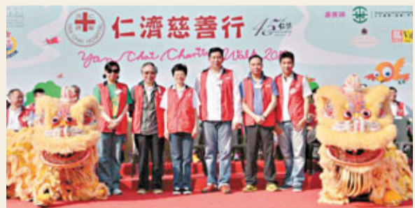
仁濟醫院籌款活動「仁濟慈善行」，眾嘉賓進行醒獅點睛儀式。

香港文匯報訊(記者 沈清麗)仁濟醫院一年一度大型籌款活動「仁濟慈善行」，日前假荃灣城門谷運動場舉行，為「仁濟社會服務基金」籌得善款逾100萬元。