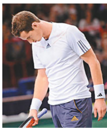
■梅利輸波後一臉沮喪。

榮譽：「數據顯示，韋伯奪冠的機會很微。他是一個聰明人，相信他會以車隊的利益為依歸。」現時韋伯的累積總分有164分，落後維泰爾73分之多。 ■香港文匯報記者 黃舒慧