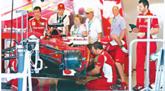
■法拉利工作人員分秒必爭。

而紅牛日前亦出面澄清，指沒有迫使韋伯在餘下的賽事中「讓路」予維泰爾，助對手完成3連冠的創舉。不過，領隊漢拿卻表示，希望韋伯能自動自覺以車隊的最大利益為考慮，助車隊爭取最大