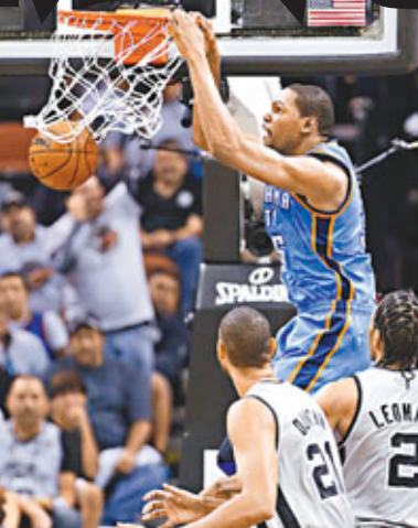
■杜蘭特(藍衣)職業生涯突破1萬分大關。

馬刺後衛東尼柏加成為「復仇者」英雄，在周四主場對雷霆的上季西岸決賽翻版戰中，這名法國球星最後一擊跳投得手，協助馬刺以86:84險勝，開季2戰全勝，並一報上季西岸決賽被擯出局之仇，而自拆「攻擊鐵三角」的雷霆在新球季首仗則落筆打三更。