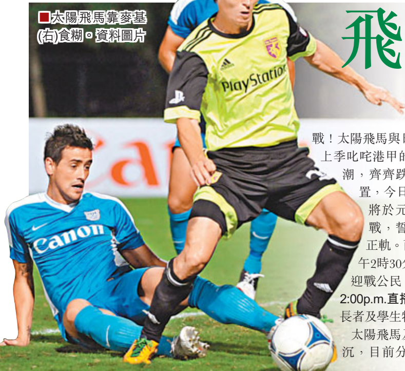
■太陽飛馬隊麥基(右)食糊。

■馬來西亞羽毛球名將李宗偉(右)與黃妙珠昨日在吉隆坡一間婚紗店試婚紗，這名羽球一哥更在傳媒面前親吻準太太，表現恩愛。二人將於下周六舉行婚禮。