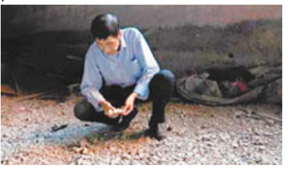
香港文匯報 (記者 陳融雲、見習記者 吳文倩 江西報道) 近日，江西省龍虎

山村民在「仙人倉」內發現有大量白骨遺骸(見圖)，據考古人員鑒定其為動物骸骨。考古專家稱，此次在「仙人倉」發現的古越人遺留下的動物遺骸，對研究古越文化有着重要意義。 龍虎山位於江西省鷹潭市境內，是中國道教名山之一。古時越人多生活於此。據檢測結果顯示，洞內這些骨骸年代跨度較大，極有可能是龍虎山的古越人在此崖洞內生活時留下的。