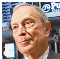
■ 彭博公開撐奧巴馬，可能只是為增加曝光率。

美國紐約市長彭博及英國財經雜誌《經濟學人》前日不約而同表示，雖然總統奧巴馬過去4年政績不算出色，但與共和黨候選人羅姆尼相比，仍是較可取之選擇。彭博的表態對奧巴馬無疑是一支強心針，但未必能為奧巴馬爭到大量游離票，也有媒體質疑彭博只是希望透過公開挺奧巴馬，增加個人曝光率，為明年市長任期屆滿後的個人政途鋪路。