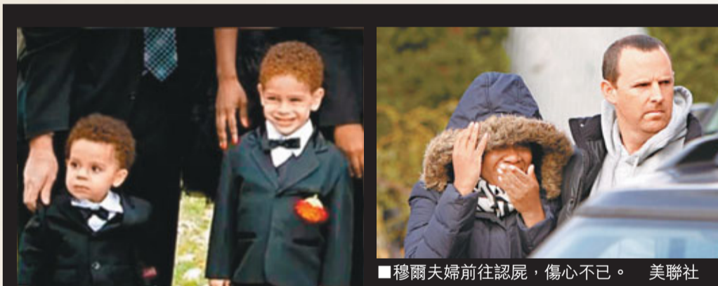
■穆爾小兄弟不幸被洪水沖走喪生。