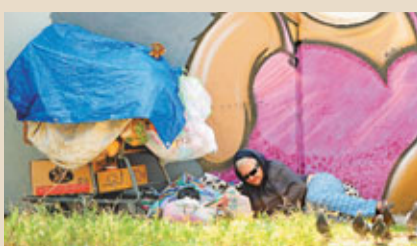
■美國失業率微升至7.9%，仍屬很高數字，不少失業人士無家可歸。

被稱為奧巴馬在大選前最後一份「經濟成績表」的美國10月份就業數據公布，儘管失業率回升至7.9%，但僅顯示重新尋找工作的人增加，屬市場預期之內。非農新增職位增加17.1萬份，8月和9月新增職位則上調共8.4萬份，遠勝預期。雖然最新就業數據顯示經濟繼續復甦，但有分析指大部分選民或已對經濟現況定調，就業報告對選情影響可能有限。