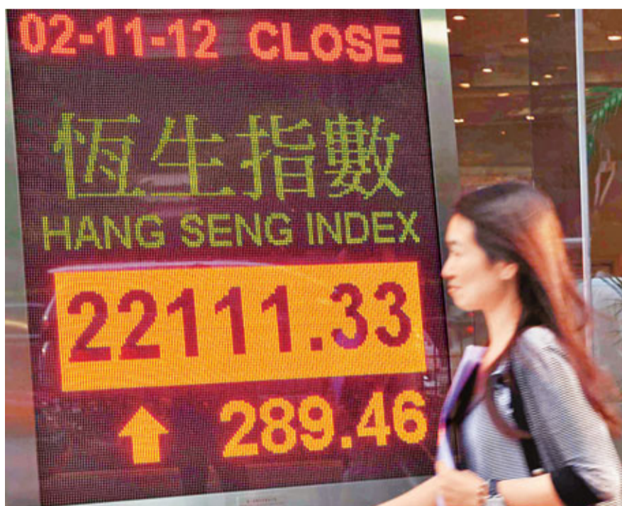
恒指昨一舉突破22,000點關口, 收升289點, 成交增至701億元。 中通訊

另外, 昨日有兩隻藍籌股創其上市以來新高, 分別為騰訊(0700)收市升0.87%至278.2元和旺旺(0151)收市升4.02%至11.4元。