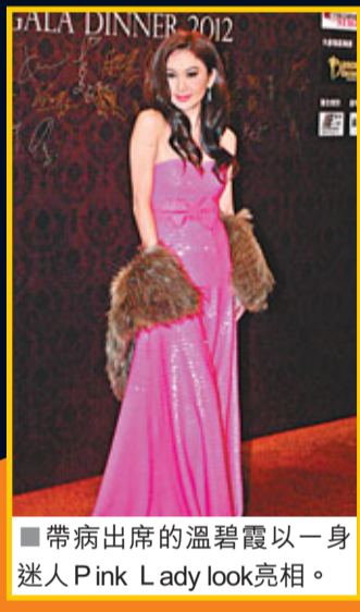
帶病出席的溫碧霞以一身迷人Pink Lady look亮相。