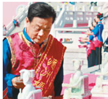
兩岸萬民信眾見證翡翠媽祖開光分靈。

當日上午9時，隆重盛大的媽祖祭典開始。據記者了解，此次開光分靈的23尊高約0.32米的翡翠媽祖分靈像與去年分靈入台的翡翠媽祖像係出同源，是兩岸媽祖情緣的重要見證。中國國民黨中常委李全教在開幕式上表示，兩岸「人同根，神同源」，媽祖文化共連香火之源，呼喚和平共贏。