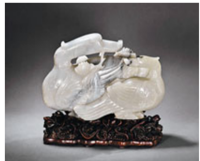
■清 黑白玉鴛鴦臥蓮擺件

興建鐵路，發現的古墓不計其數，而當時的中國社會十分混亂，政府無力制止農民盜走古墓內的陪葬品。北京和上海的古董商活動範圍極廣，在河南、安徽、陝西以及內蒙古等地均派有線人長期守候，鄉民掘到的東西，他們馬上收購，於是這些出土品先是到了北京和上海的古董店，再賣給當時最出得起價錢的美國、英國和日本收藏家。這些出土陶瓷被賣至歐洲，改變了西方人只認知中國外銷瓷的局面，開啟了歐洲收藏與研究中國陶瓷的熱潮。