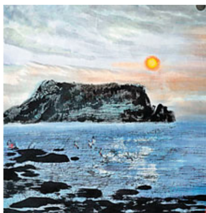
■朝輝 王明明 紙本設色

據介紹，江西年底將組織畫家赴台交流，明年4月則將赴港參加春季佳士得的活動，以逐步擴大國際影響力。據悉，自古以來，中國書畫大師有60%出自江西，但江西本土的書畫拍賣市場開放並不長。另一方面，江西歷代名家的書畫卻屢屢拍上天價，目前內地字畫拍賣的最高紀錄就由江西書畫名家黃庭堅《砥柱銘》的4.368億元人民幣長期佔據。業內專家稱，看好江西書畫拍賣升值空間。