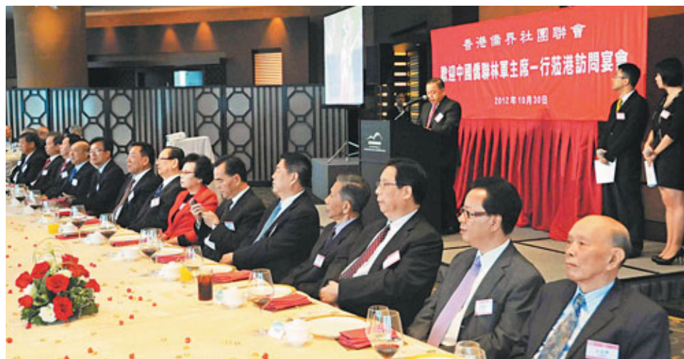
港僑聯舉行午宴歡迎中國僑聯主席林軍蒞臨香港並與林軍主席一行親切交流。

輝,海外聯誼部副部長孔濤以及桑寶山、馬鑫、徐友佳、華清文、陳智超,香港僑界社團聯合會主席邱維廉,常務副會長陳金烈,副會長梁滄基、李碧碧、李潤基、王錦彪、李