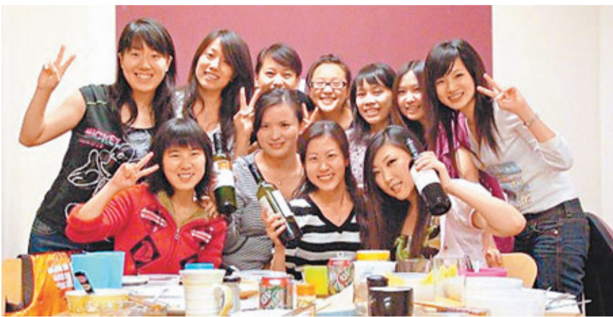
近年內地生來港求學,不少要在校外租屋。圖為內地生聚餐。資料圖片

香港文匯報訊(記者 歐陽文情)香港租金高昂,一些不獲分配院校宿舍的內地生除了選擇高居「劏房」外,也出現了「非情侶的男女合租」,以分擔租金。不同地區的地產代理均表示,非情侶的男女合租近年有上升趨勢,約每10單內地生租屋生意中就有1單。同一屋簷下,有人不介意屋子裡有男有女,亦有人覺得與異性同住諸多不便,合租1個月後即退出。有學者認為隨着社會風氣日益開放,男女合租沒有甚麼問題,又指室友的人品和生活習慣比性別重要,作為大學生亦應為自己的行為負責。