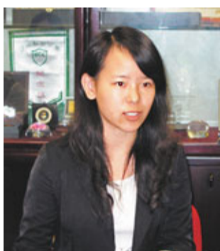
吳丹憑「基於PETAL技術特製的大尺寸背光專用LED模組」亦躋身六強。