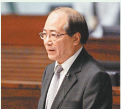
吳克儉要求英基向有意申請提名權的家長清楚交代計劃詳情。

香港文匯報訊(記者 劉景熙)每年接受政府達2億元資助的英基學校協會,早前推出「提名權計劃」,家長只要為每名子女繳交50萬元「提名費」,而學生達到入學要求,便可獲優先分配學位,引來部分家長不滿,擔心計劃把教育變成金錢交易,違反公平辦學精神。教育局局長吳克儉昨回應指,已要求英基向有意申請提名權的家長清楚交代計劃詳情,確保家長在申請過程中獲充分資訊,局方也會要求英基在賬目中清楚列明提名權計劃下的收入及財務狀況,確保所得金額符合其指定用途。