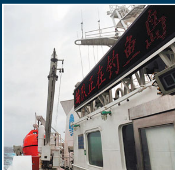
■海監50船的顯示板顯示該船正在釣魚島海域巡航。 資料圖片