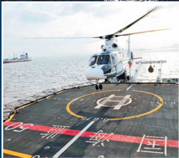
■中國海監50船有船載B7115直升機。 資料圖片