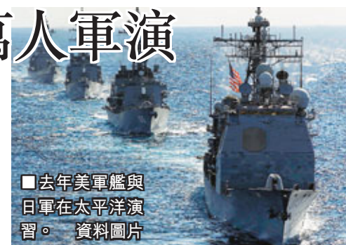
■去年美軍艦與日軍在太平洋演習。 資料圖片

據日本共同社報道，防衛省統合幕僚監部（相當於總參謀部）昨晚並沒有就訓練內容和訓練場所等進行詳細說明，只稱「由於各種原因」將不便向媒體公開。但透露在這次演習中，日本自衛隊將派出3.7萬自衛隊員、30艘艦艇以及240架各種戰機參加；而美軍方面則會派出逾萬人參加，並出動1艘兩棲登陸艦負責運送日本自衛隊員。