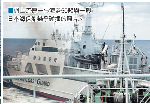
■網上流傳一張海監50船與一艘日本海保船幾乎碰撞的照片。