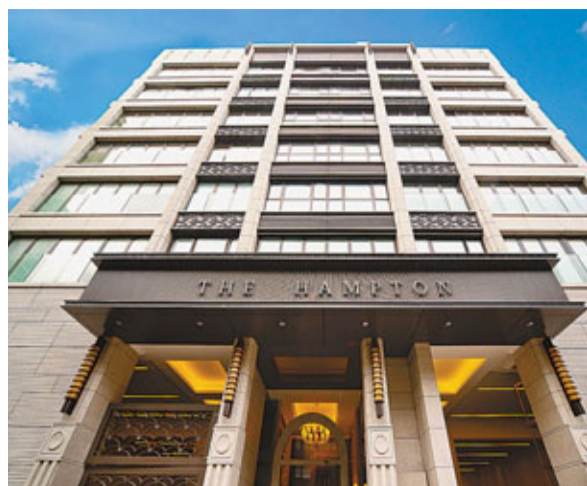
有消息指，The Hampton擬以公司股東轉讓形式買賣，以避過繳付印花稅。

香港文匯報訊（記者 梁悅琴）針對市傳有發展商透過把新盤注入開設的子公司，再以公司股權買賣方式出售以避繳交「買家印花稅」的漏洞吸客，政府昨