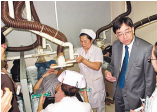
■高永文今日下午參觀廣東省中醫院,親身了解該中醫院的運作。

高永文等人昨日與廣東省衛生廳及廣東檢驗檢疫局高層會晤,雙方在食品安全管理、傳染病防控、醫院管理、中藥服務貿易、落實CEPA協議以及過境貨物的檢驗檢疫等6方面深入交流,在肯定兩地