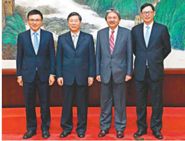
■曾俊華(右二)昨日在北京與中國銀行業監督管理委員會主席尚福林(左二)會面。

今日,他們會拜會國家商務部,並與在北京工作的港人見面,了解他們的生活狀況。隨後,他們會到天津考察1