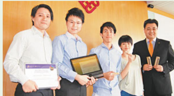
「理大微基金」共有16個項目各獲資助10萬元作為種子基金。圖為各得獎者合照。

香港文匯報訊(記者 劉思諾)不少年輕人希望能「做老闆、話晒事」，盡情發揮自己創意想法及商業意念。理工大學為推動校友及學生創業，今年舉行第二屆「理大微基金計劃」，每組獲獎新公司均可獲得10萬元的「種子基金」開展其業務。但其中4位「新晉老闆」不約而同表示：「老闆唔易做！」除要有足夠經費外，更需要有「一團火」；即使遇上挫折，甚至一貧如洗的時候，仍然可以堅持自己理想。