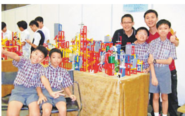
大埔舊墟公立學校(寶湖道)的機關設計「香港之最」，加入昂坪360和青馬大橋。

至於初中組皇仁書院的「香港一日遊」，則有14個高難度機關，實在是「機關重重」。中四生譚峻恩表示，他們利用磁石製造出「高斯加速器」，使波子在瞬間加速，並利用「能量守恆」的