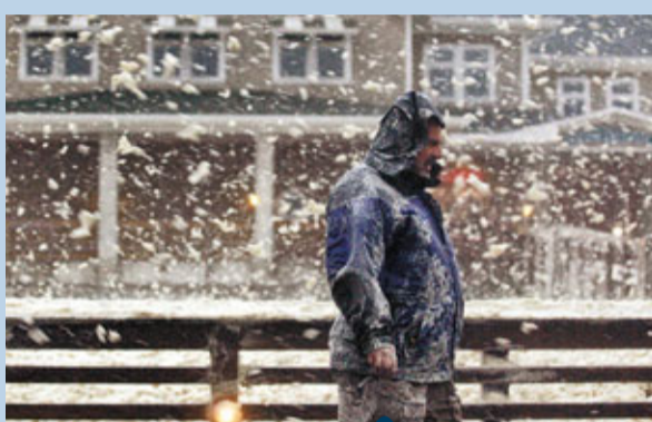
大風吹起海泡。