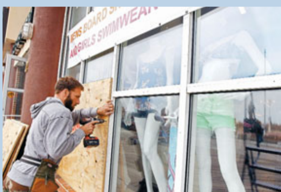
民眾在店舖玻璃外圍起木板對抗強風。