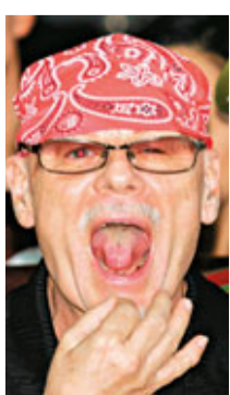
68歲的Gary Glitter於當地時間昨晨7時15分被捕。警方沒有透露被捕者身

份，只稱逮捕一名涉嫌違反性罪行、屬於「薩維爾及他人」案件的60歲男子，並將他帶返警署扣查。不過BBC及英國天空電視台報道，疑犯正是Gary Glitter(見圖)。