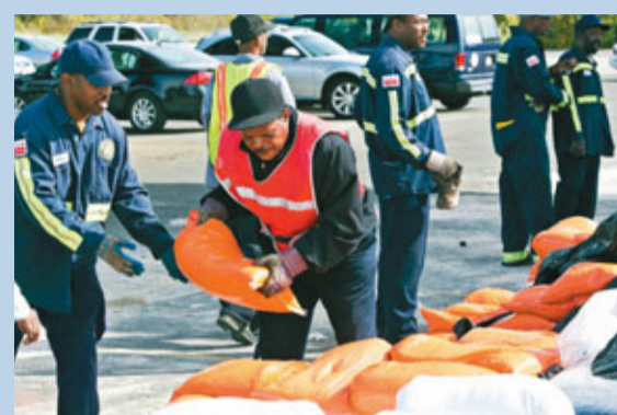
政府部門加緊準備沙包防災。