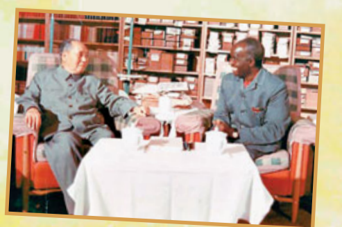
■ 毛澤東主席會見時任贊比亞總統卡翁達。網上圖片

等部族王國。1889~1900年英國人羅得斯建立的英國南非公司逐漸控制了東部和東北部地區，1911年英國將兩地合併，以羅得斯的名字命名為「北羅得西亞保護地」。1964年10月24日正式宣佈獨立(獨立日即國慶日)，定國名為贊比亞共和國，仍留在英聯邦內。1973年8月通過新憲法，宣佈進入第二共和國。1990年12月議會通過憲法修正案，實行多黨制。