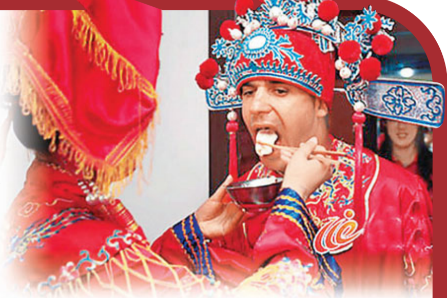
■ 在國際麻將賽事上，隨處可聽到夾雜着外國口音的普通話「吃」、「碰」、「槓」、「和」。