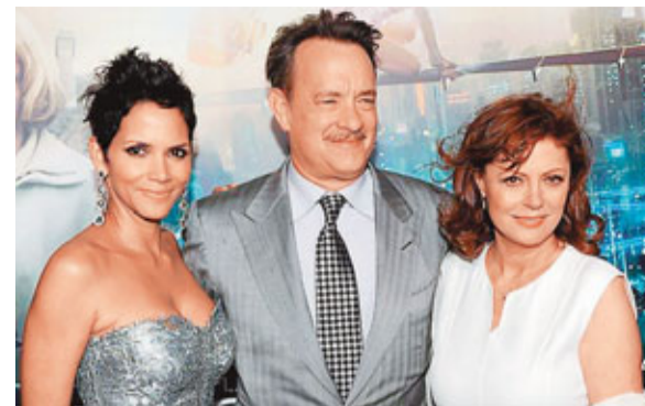
■ 荷爾芭莉(左)與湯漢斯(中)及其他演員合照。