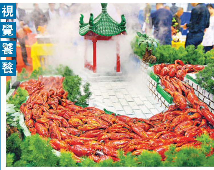
為期3天的2012中國(江蘇)國際餐飲博覽會暨第七屆江蘇省創新烹飪技術比賽昨日在南京國際展覽中心開幕，本屆餐博會以「文化餐飲、品味生活」為主題。

東湖地處武漢城區二環和中環之間，湖面積達33平方公里，是中國最大的城中湖。穿越東湖這一通道，預計將於2014年底通車。