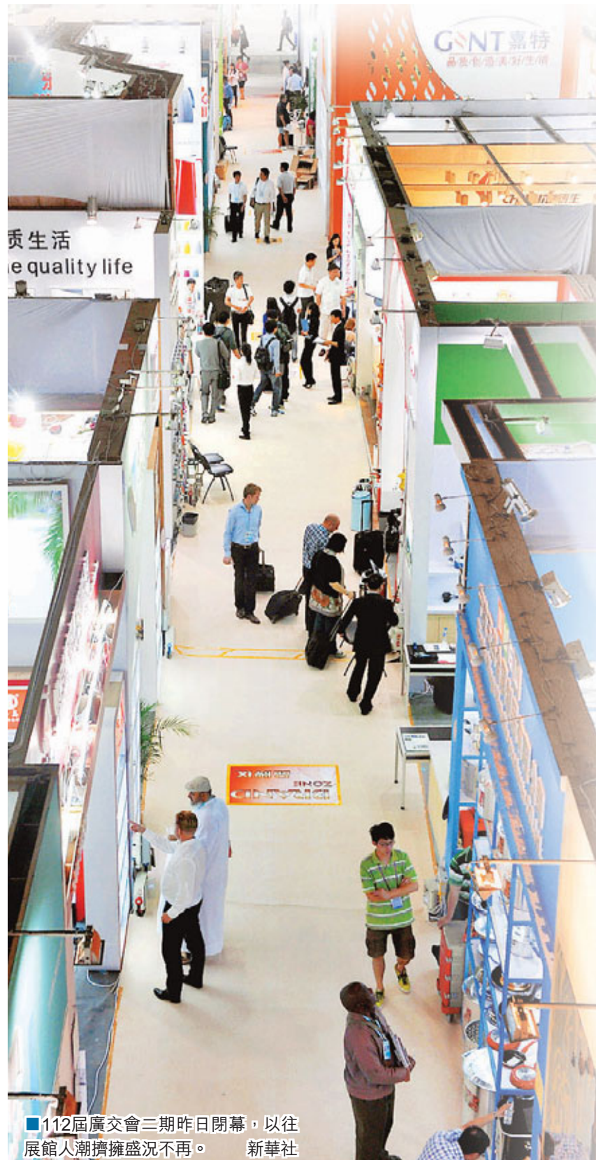
112屆廣交會三期昨日閉幕，以往展館人潮擁擠盛況不再。

但是對於今年廣交會參展人數的下滑，彭澎認為，一方面是由於外貿出口形勢不見好轉，而另一方面則是由於傳統的內地企業搭台唱戲、國際採購商下訂單的交易模式正在悄然發生變化。他認為，隨著電子商務交易平台的興起，以布展為主的傳統採購交易平台漸漸發生了功能與角色的轉變，「網絡交易平台誕生以後，熱門熱路的國外採購商可以通過網絡對接企業完成交易。此外，差旅、住宿、搭台費用的逐年提高，也使企業為縮減開支，而更願意通過網絡進行交易」。而在全球經濟不景的背景下，廣交會承擔的角色也可能從以往的下單有所轉變，轉變為產品和技術展示。