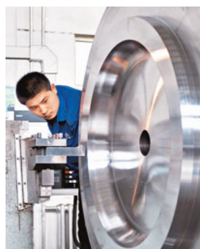
內地工業企業利潤增長7.8%，是今年3月以來首度由負轉正。

香港文匯報訊(記者 劉凝哲 北京報道) 國家統計局昨日發佈消息稱，1-9月份，內地規模以上工業企業實現利潤約35,240億元，同比下降1.8%。9月利潤4,643億元，同比增長7.8%，是今年3月以來首度由負轉正。