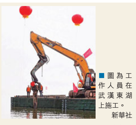
圖為工作人員在武漢東湖施工。

據新華社電 總長超過10公里的「東湖通道」工程昨日在中國最大的「城中湖」武漢東湖正式開建。