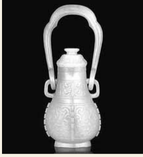
清乾隆青玉雕做古獸面紋提樑卣。