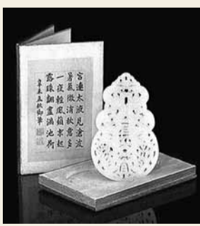
清嘉慶白玉鑲雕鳳紋長宜子孫牌。

香港文匯報訊 下月8日,英國邦翰斯拍賣行將拍賣兩件圓明園流失文物,分別是「清嘉慶白玉鑲雕鳳紋長宜子孫牌」和「清乾隆青玉雕做古獸面紋提樑卣」。