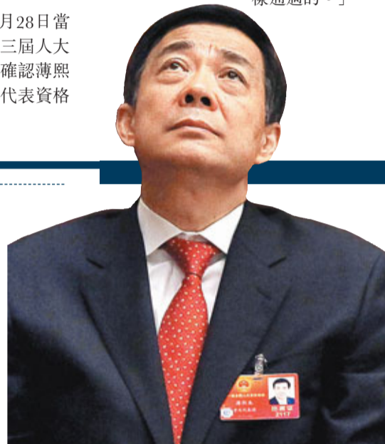
此後,經過近10個月的審理,2008年4月11日,天津第二中級人民法院一審判處陳良宇犯受賄罪,判其入獄14年,沒收30萬元人民幣個人財產;犯濫用職權罪,判其入獄7年,兩罪並罰,決定執行有期徒刑18年,沒收個人財產人民幣30萬元。

全國人大常委范麗泰此間在接受媒體採訪時表示,人大常委會是按程序批准通過終止薄熙來的人代資格。她說:「只要他當選那個地方的人大常委會說要取消他(薄熙來)的人代資格,我們這邊是照樣通過的。」