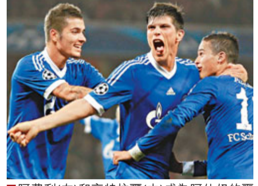
■阿費利(右)和亨特拉爾(中)成為阿仙奴的噩夢。

陣容不整的阿仙奴本輪聯賽爆冷輸波後已落後榜首10分，昨晨歐聯更遭史浩克04的荷蘭仔寶亨特拉爾與阿費利轟破大門。在末獲「泵水」擴軍及7年無冠的惡性循環下，阿仙奴近年流失了很多球星，而在今夏賣人得來的錢重金引進的新兵中，進攻中場辛迪卡索拉與普多斯基只屬表現對辦，中鋒基奧特則不時死火。球隊目前又有後衛哥斯尼、基蘭基比斯，中場戴亞比、禾確特與阿歷士張伯倫大批傷兵，影響實力，而是役代基比斯踢左閘的巴西戰將安德里山度士，表現更可以災難來形容，慘遭法芬多次蹂躪。9年來主場首負外敵阿仙奴近44次在主場踢歐戰只輸過1次，對上一次主場輸給外國對手，更已是2003年之事。賽事第77分鐘，阿費利