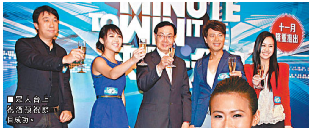
眾人台上祝酒，慶祝節目成功。