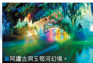
■阿盧古洞玉筍河幻境。

地址：雲南省紅河州瀘西縣阿盧山麓（距離瀘西縣城2公里） 交通：在瀘西縣乘票價1元的巴士直達。