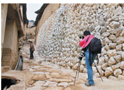
■清代所建「將軍第」的正房後牆基，村人稱為「姐妹牆」，由毛石疊成，銜接緊密，沒有灰漿粘亦無打磨痕跡。

當時，「永安城」是彝族白甸部的聚居區，明清兩代，北方漢族「改土設流」大量湧入，彝族、漢族大融合，就漸漸形成彝漢獨特風格的城子土掌房。