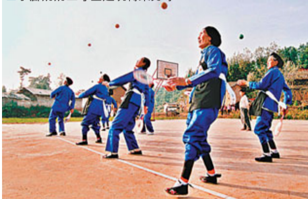
■小腳奶奶三寸金蓮玩轉柔力球。

一頂黑色蓮花帽，一身藍色繡花土布衣衫，一雙隨時代留下的袖珍小腳，伴着歡快的音樂，8名年事已高的老奶奶齊步上陣，右手拿着柔力球在拍，單腿站立將球從腿下拋出，玩轉柔力球，身輕如燕，比年輕人還靈活矯健。「小腳奶奶柔力球隊」裡年紀最大的有85歲，最小的74歲。她們聞名十里八鄉，吸引遊客駐足合影，贏得海內外一致讚賞。這樣一群幸福生活的「小腳奶奶」，開心自信地玩轉柔力球。看着她們，你也會被快樂的氛圍感染。