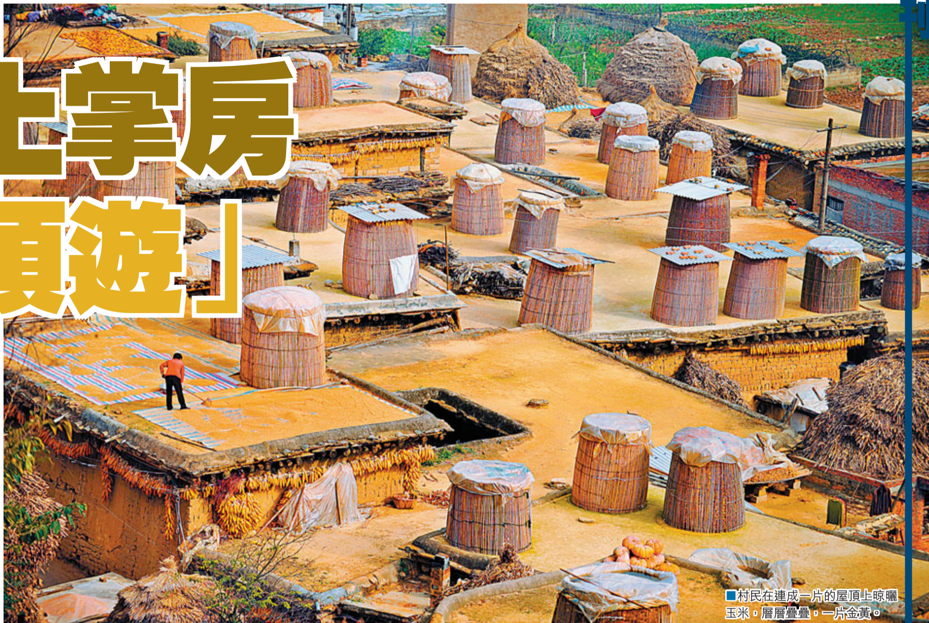
■村民在連成一片的屋頂上晾曬玉米，層層疊疊，一片金黃。

晨光穿過薄霧，輕輕掀開古村的面紗。跟着水牛沿光滑石階層層而上，暖黃色的玉米是田園畫的絢麗筆調，嬉鬧的孩童是鄉村曲歡快跳動的音符。踩在古村鬆軟的屋頂上，淡淡稻香隨風撲鼻，碧波荷塘盡收眼底，聲聲蛙鳴反添恬靜。若你在城市樊籠裡倦了心，不妨從鄉土民俗裡尋找快樂。