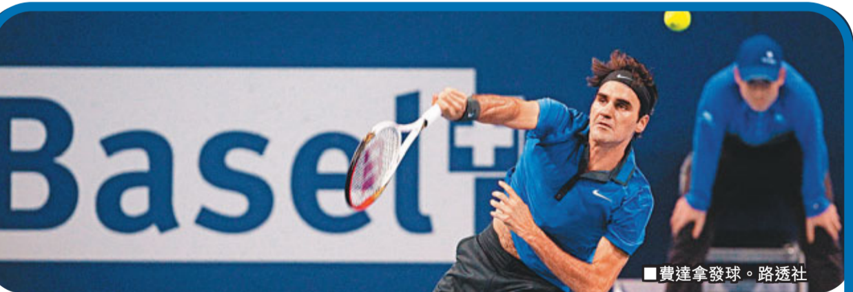
■費達拿發球。