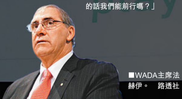
■WADA主席法赫伊。

他認為，任何與岩士唐時代醜聞有關的人都不能再在國際單車聯盟的管理層中擁有合法職位，「他們不能再自欺欺人了，必須檢查過去，調查那個時期的那些人，捫心自問：同樣的那些人還在這項運動中嗎？把他們留在這裡的話我們能前行嗎？」