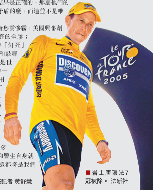
■岩士唐環法7冠被除。