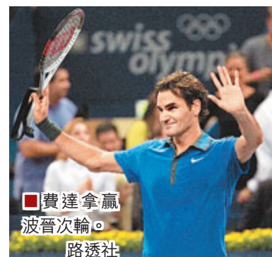
■費達拿贏波晉次輪。路透社

截至目前，本賽季費達拿已經獲得6項冠軍，是ATP球員中最多的。如果在巴塞爾成功衛冕，他的ATP冠軍總數將升至77個。