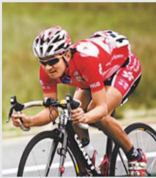
■香港文匯報記者 梁啟剛

岩士唐案導致一顆單車巨星墜落，再次將體育界與興奮劑黑幕掀開一角；不過，外界對此案的強烈反應，也證明通過多年不懈的努力，打擊興奮劑成為共識，「興奮劑」越發成為體育界不可觸及的紅線。