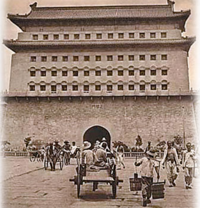
叫賣聲聲聞小巷