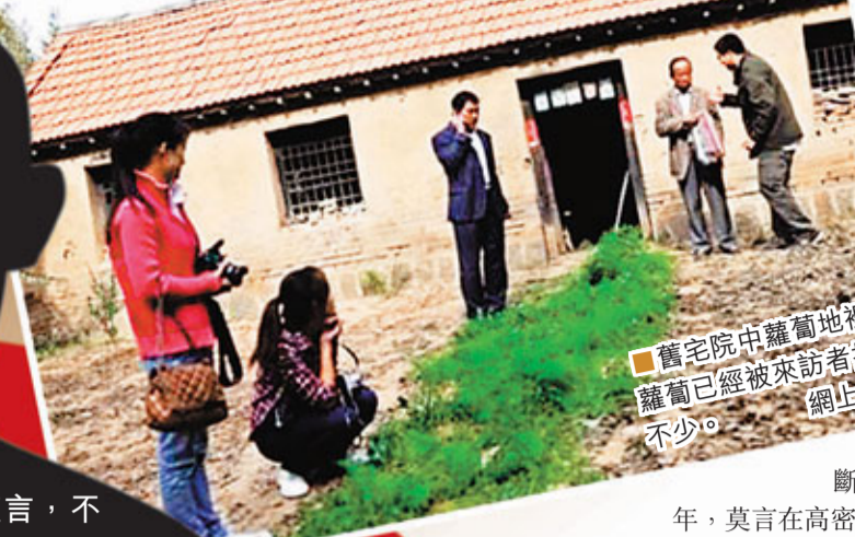
舊宅院中蘿蔔地裡的蘿蔔已經被來訪者拔去不少。

莫言舊居是1912年建成的，1966年翻修過一次，1955年到1976年，莫言從出生到從軍離開，在這裡生活了約22年，後來在當兵期間，回鄉探親，也斷斷續續地住過。1988年，莫言在高密縣(現在的高密市)買了房，和妻子杜勤蘭及獨生女兒笑笑從舊屋遷出。1990年，莫言的父母也從這裡搬到莫言的二哥管談欣的家裡，這座老宅，自此閒置。