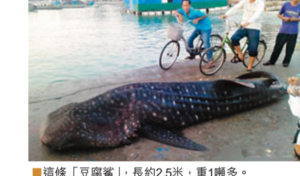
這條「豆腐鯊」，長約2.5米，重1噸多。

漳州東山縣陳城鎮宮前村的漁民近日在閩粵海域捕撈作業時，意外捕獲一條鯊魚，引來眾多圍觀村民稱奇。這條鯊魚叫「豆腐鯊」，長約2.5米，重1噸多，是誤撞入漁網而被打撈上岸的。 當時，當地漁民開着兩艘漁船並排拖網，發現了這條鯊魚。漁民將這條鯊魚打撈起來，裝到其中的一艘船上運回碼頭。陳城邊防所民警接到漁民報警後趕到現場。此時，這條鯊魚雖然還能呼吸，但嘴和鰓部流了不少血，看上去已經很虛弱了。由於時值傍晚海水退潮，只好等到漲潮才能放生。 「豆腐鯊」學名鯊鯊，在中國海域非常少見，是非常珍貴的物種。 漳州海洋漁業局的蘇副局長說，漳州海域已知的鯊魚種類比較多，鯊魚生性兇猛，但被撈上岸後一般很難存活，最好第一時間放歸海裡。 ■《東南網》