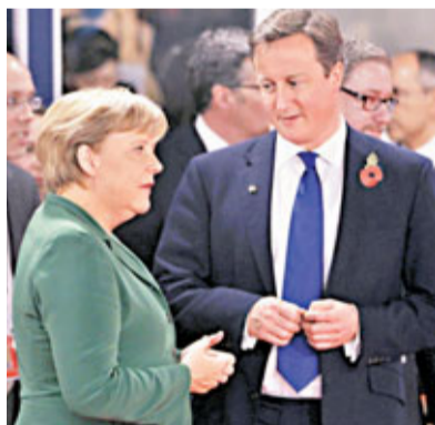
■卡梅倫(右)立場強硬，默克爾據報威脅取消原定下月舉行的預算會議。

歐盟統計局昨公布，歐元區去年債務增至GDP的87.3%，是1999年歐元發行以來最高水平。歐元區17國中以希臘債務比率最高，達170.6%，總額3,650億歐元(約3.7萬