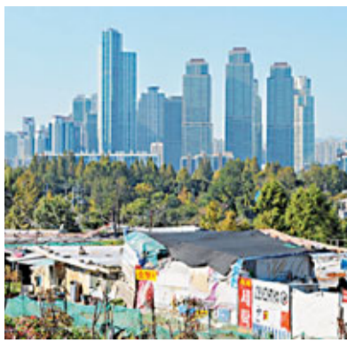
■貧民窟「九龍」的背景就是繁華的江南區。

韓國歌手PSY以一曲《江南Style》紅遍全球，但豪華時裝店及夜總會林立的首爾江南區背後，卻隱藏着一個猶如第三世界的貧民區——九龍(Guryong)。當地2,000居民多是年過古稀的獨居老人，住簡陋寮屋，欠電力供應，沒暖氣設備，冬天要燒煤取暖。