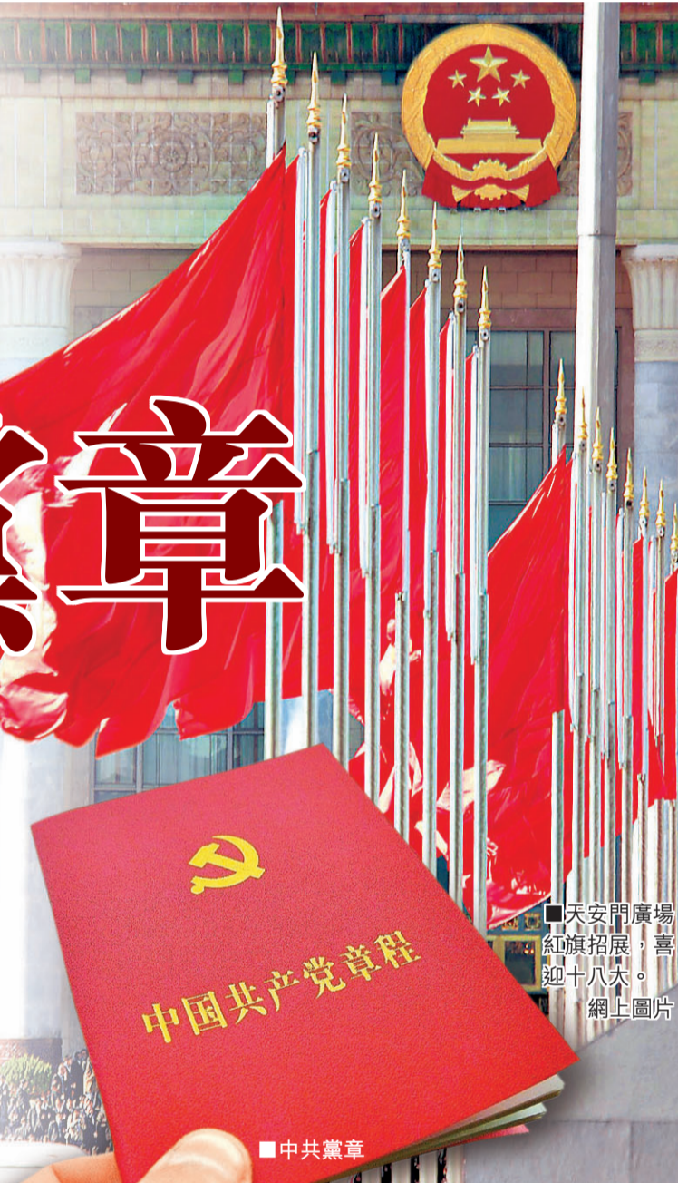
■天安門廣場 紅旗展開，喜迎十八大。

會議認為，黨章是黨的總章程，對推進黨的工作、加強黨的建設具有根本性的規範和指導作用。黨的十八大根據形勢和任務發展變化對黨章進行適當修改，有利於全黨更好學習黨章、遵守黨章、貫徹黨章、維護黨章，更好把中國特色社會主義偉大事業和黨的建設新的偉大工程推向前進。