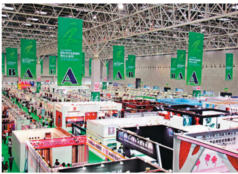
■柯橋國際紡織品博覽會(秋季)共有567家縣內外企業預定標準展位1,309個。圖為今年春季博覽會狀況。資料圖片

2012年秋季紡博會主展區設1,309個,展覽面積3.1萬平方米,主要展品為紡織面料、紡織機械等,分紡