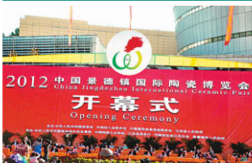
■景德鎮國際陶瓷博覽會開幕式現場。

香港文匯報訊(記者 陳融雪、實習記者 徐榮生 江西報導) 2012中國景德鎮國際陶瓷博覽會日前在江西省「瓷都」景德鎮開幕,全國政