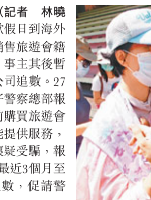
■丘小姐希望報警可停止收數公司滋擾行為。

香港文匯報訊(記者 林曉晴)不少港人喜歡假日到海外旅遊，但有公司銷售旅遊會籍後未能提供服務，事主其後暫停供款，卻被該公司追數。27名事主昨日到灣仔警察總部報案，稱4年至6年前購買旅遊會籍後，因公司未能提供服務，於是停供。他們懷疑受騙，報稱涉款300萬元，最近3個月至4個月卻被公司追數，促請警方介入調查。