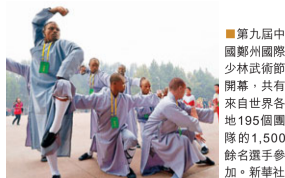
第九屆中國鄭州國際少林武術節開幕，共有來自世界各地195個團隊的1,500餘名選手參加。

第九屆中國鄭州國際少林武術節21日在河南鄭州開幕，吸引了73個國家和地區1,500多名功夫高手，規模和人數遠遠超過往届。