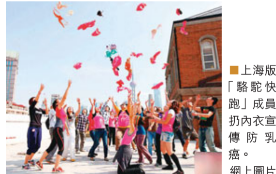
上海版「駱駝快跑」成員扔內衣宣傳防乳癌。

世界乳腺癌防治月上海版「駱駝快跑」城市7.8km跑步行動20日在上海蘇州河畔進行，該活動由上海公益組織牽頭，通過跑步的形式，喚起女性對乳腺癌的重視，增強公眾對乳腺癌的防治意識。 ■中新網