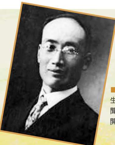
戈公振先生是中國新聞史研究的開拓者。

1985年11月26日，《人民日報》發表戈公振對戈公振的紀念文章《回憶叔父戈公振二三事》。