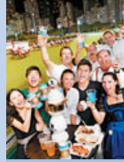
■跑馬地馬場的十月啤酒節

另外，全港傳統正宗「十月啤酒節」亦於10月24日及11月7日重臨跑馬地馬場，以啤酒烹調秘製美食，更有德國樂隊遠道而來表演，令大家仿如置身德國慕尼黑。屆時跑馬地馬場將換上巴伐利亞式藍白色佈置，大家可近距離觀看賽馬及參與現場有獎遊戲。