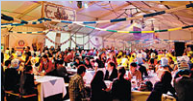
■位於印度遊樂會的「Erdinger德國十月啤酒節」

「Erdinger德國十月啤酒節2012」將於10月26日及27日假印度遊樂會舉行，為大家供應不同款式的德國小麥啤，美酒再配上色香味俱全的傳統小食及經典遊戲。啤酒節的另一焦點還落在娛樂性豐富的遊戲及表演節目上，場內設有經典遊戲區。當中極具代表性的「推啤酒桶競走賽」將首次登陸香港，參賽者只要用最短時間推動啤酒桶及運送啤酒便能取勝。如你自問臂力與才智並重，不妨一試。你亦可以參加另一經典遊戲「Cheers！Cheers！舉啤酒耐力戰」及每年必備的「最受歡迎Erdinger十月啤酒節服飾選舉」，與現場朋友一較高下，問鼎冠軍。