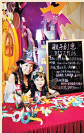
■ MegaBox Halloween扭蛋機