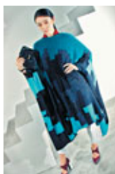
■ 3.1 Phillip Lim

至於紐約時尚品牌3.1 Phillip Lim秋冬季女裝服飾系列設計靈感則來自Frank Miller執導的《Sin City—罪惡城》，以黑白兩色探索Neo-Noir新黑色漫畫的時尚美學為主題，正好與畫廊簡潔亮白的場地空間互相配合，展現品牌秋冬系列中別開生面的錯視效果。