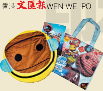
香港文匯報 WEN WEI PO

Megabox特別為本報讀者送出萬聖節禮品，禮品包括《小小大星球》A4文件夾 (HK$40) 兩個、《小小大星球》環保購物袋 (HK$280) 及《小小大星球》坐墊 (HK$280)，總值HK$640，名額共5位。如有興趣的讀者，請剪下此文匯報印花貼於信封背面，連同HK$2.8回郵信封郵寄至香港仔田灣海旁道7號興偉中心3樓副刊時尚版收，封面註明「MegaBox萬聖節送禮」，截止日期10月28日，先到先得，送完即止。