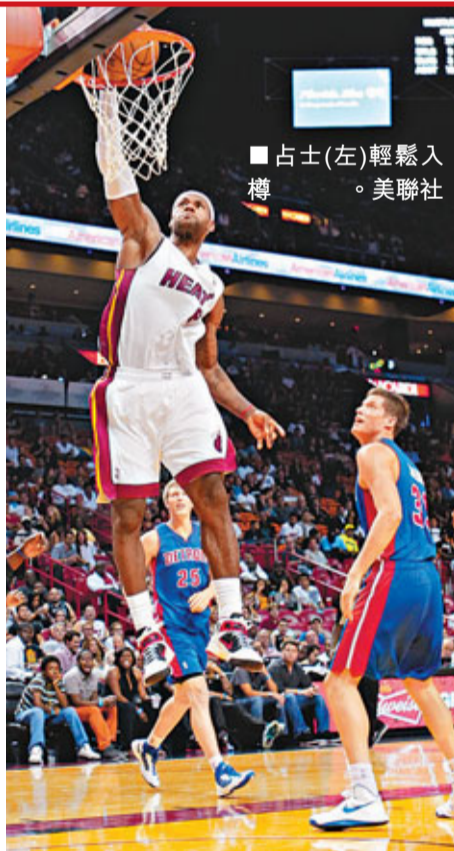
占士(左)輕鬆入樽。